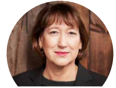
Hildegard Müller Präsidentin, Verband der Automobilindustrie e.V. (VDA), Berlin

Besuchen Sie uns am 18. und 19. Februar im Maritim Hotel & Internationalen Congress Center Dresden. Wir freuen uns auf Sie.